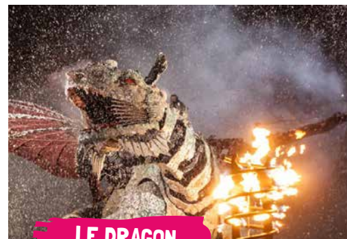
LE DRAGON DE CALAIS

Impressionnant avec ses 15 mètres de haut, ses 25 mètres de long et ses 72 tonnes, le Dragon de Calais est une construction monumentale en acier et bois sculpté. Très expressif, il crache du feu, de la fumée et de l'eau.